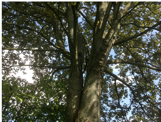
, 02 Septembre 2013