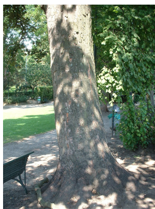
, 04 Août 2003