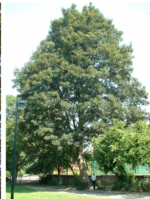
, 04 Août 2003